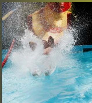
Petite pause rafraîchissante possible dès le 29 juin 2013

Le début d'année à été propice aux naissances à Touroparc. Il y a eu celle de Gaïa, jeune girafon femelle née le 16 février dernier, qui partage son espace de jeu avec le jeune zèbre né le 3 avril, et la dernière en date et non des moindres est celle d'un bébé tapir arrivé le 15 juin.